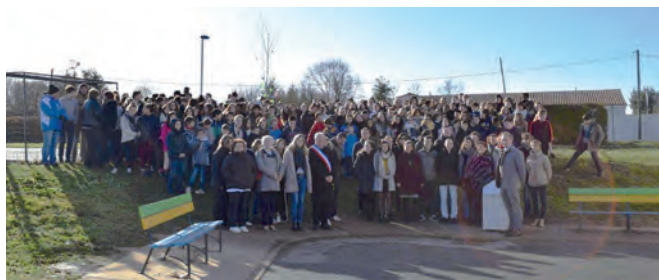
Les collégiens ont célébré la fête de la laïcité avec les élus.

Le tableau offert à la municipalité par l'ASPABE (Association des Sculpteurs et des Peintres de Brioux et des Environs) a été dévoilé lors de vœux du maire.