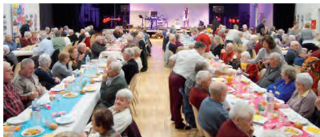
Le repas des aînés pour la première fois à « La Boutonnaise ».