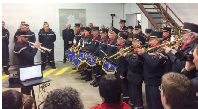
Les décorations des pompiers et l'inauguration des nouveaux locaux du Centre de Secours.