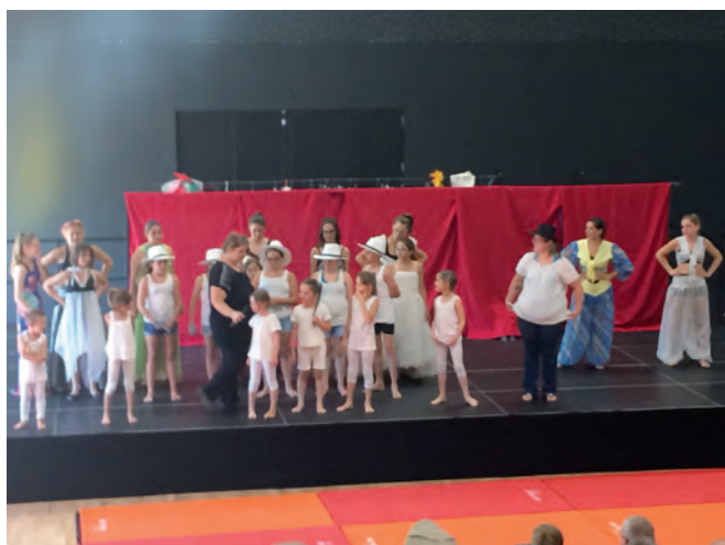
Le 14 juillet 2017