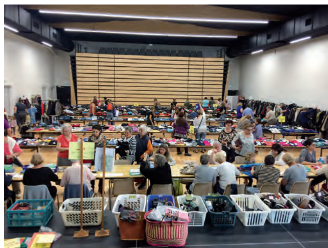
La bourse aux vêtements